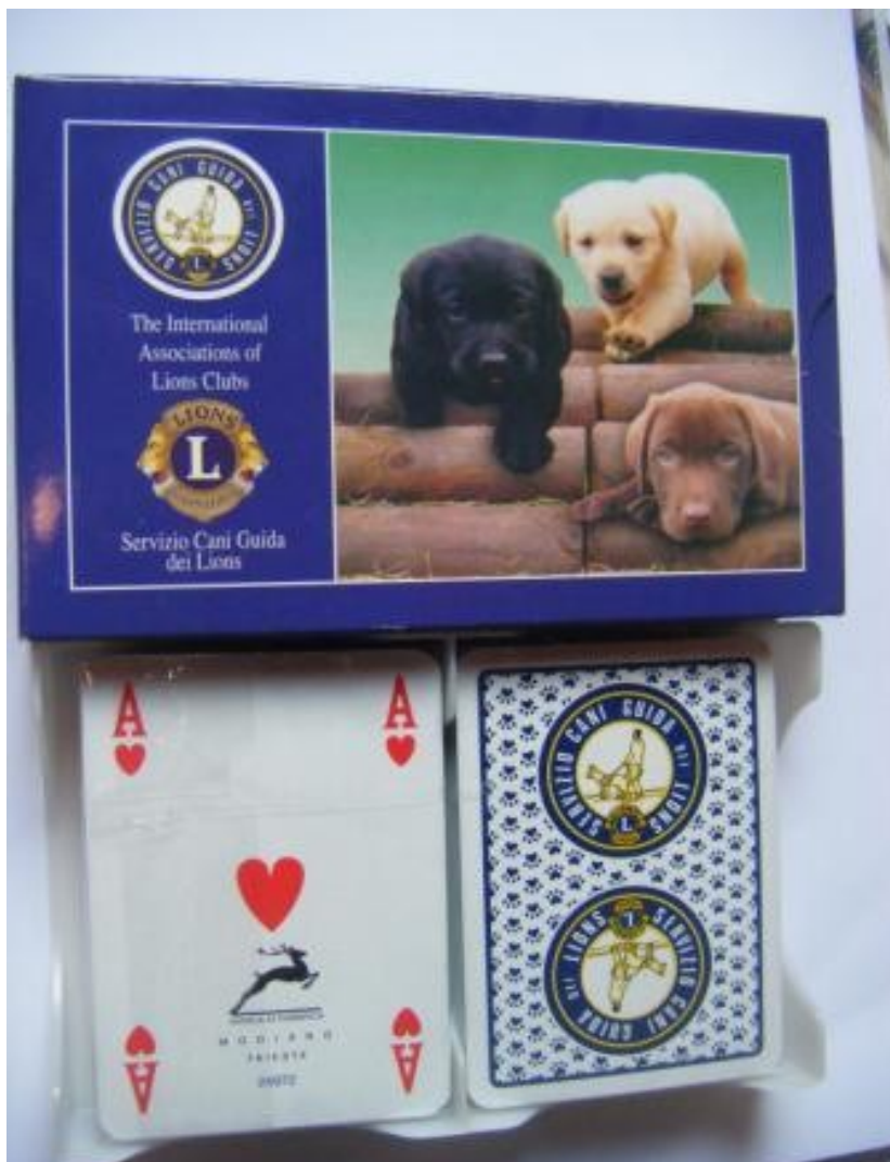
Sosteniamo il Servizio Cani Guida Lions