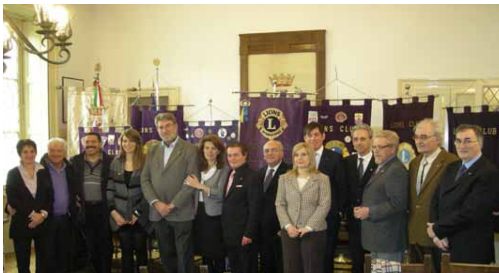
Conferenza stampa del 14_03_2012

Lo spettacolo teatrale “La Fortuna con la F maiuscola” di Eduardo de Filippo e Armando Curcio nasce su proposta dei Lions Club della Zona 2B del Distretto 108 Ib1, ovvero LC Casale Litta VALLI Insubriche, LC Gallarate Host, LC Gallarate Seprio, LC Lonate Pozzolo Brughiera, LC Sesto-Somma, LC Solbiate Arno Valle Arno, LC Tradate Seprio, Leo Club Gallarate. L’evento proposto ha la finalità di raccogliere fondi a favore del “Banco per la famiglia” Madre Teresa di Calcutta onlus di Gallarate. Questa associazione di 270 volontari opera dal 1996 per l’assistenza a famiglie e singole persone in difficoltà, principalmente per l’aspetto alimentare, con l’obiettivo di aiutarle al ritorno all’autonomia.